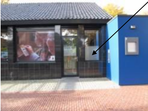
AED hangt in het Pinhokje Rabobank Hoofdstraat 33