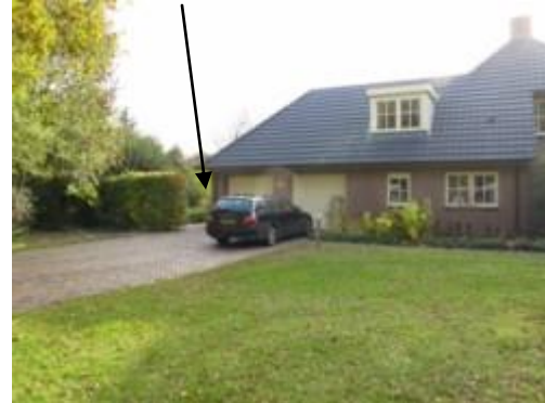
AED hangt aan de zijkant (Kymmelskampen) Fam. Smid Oude Coevordeweg 2