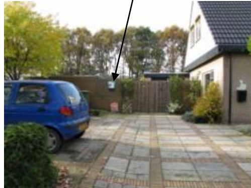
AED hangt aan de schutting Fam. v/d Wal Meester Cassastraat 13