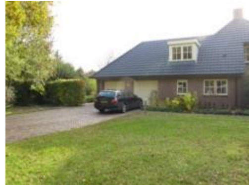
AED hangt aan de zijkant (Kymmelskampen) Fam. Smid Oude Coevordeweg 2