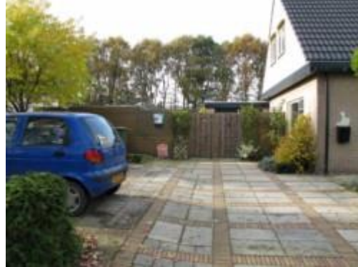
AED hangt aan de schutting Fam. v/d Wal Meester Cassastraat 13