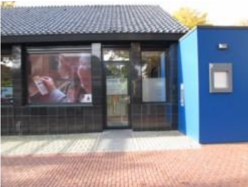
AED hangt in het Pinhokje Rabobank Hoofdstraat 33